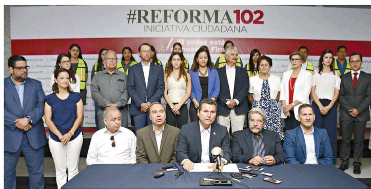
La Coparmex local presentó la iniciativa ciudadana #Reforma102.

Una vez concluida la reestructura, el presidente de Coparmex Coahuila Sureste dijo que esperan que sea retomado el tema del Comité y del Fideicomiso del ISN, asimismo añadió que los ingresos de este impuesto no deben de comprometerse para así sentarse otra vez en la mesa y ver el plan de las obras en proceso y las que vienen, para así designar cuáles son las más adecuadas para el desarrollo y la infraestructura de Saltillo.